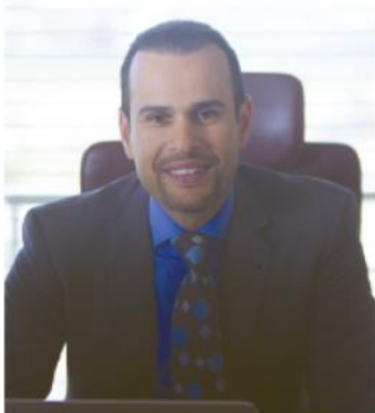
نوفل لحلو رئيس الفدرالية المغربية للصناعات الصحية

عقدت الهيئات الإدارية الجديدة للفدرالية المغربية للصناعات الصحية (FMIS) يوم 22 مارس الجاري، اجتماعا برئاسة نوفل لحلو، لوضع اللمسات الأخيرة على خريطة الطريق للسنوات الثلاثة المقبلة.